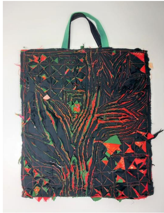
Blue Waves Of Fabrik Kodin sisustustuotteita chenille-tekniikalla Essi "Henni" Keränen